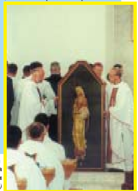
Дар Святейшего Отца Духовной Семинарии

Просим Тебя предстоять на сегодняшней молитве, наставить и укрепить своим словом, и удостоить нас и всех своим Апостольским благословением.