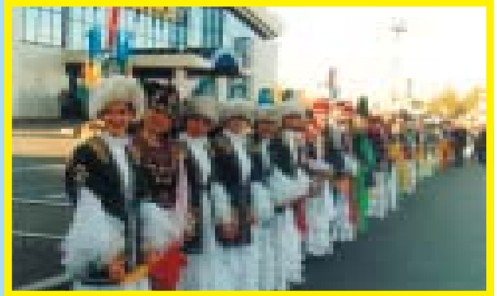
В ожидании Святейшего Отца

Впервые столицу Казахстана посетил Наместник Христа Папа Римский Иоанн Павел II. Это была его 95 зарубежная поездка и 127 страна. Иоанн Павел II уже 23 года управляет Апостольским Престолом. Во всем мире он известен как Паломник мира и защитник моральных ценностей.