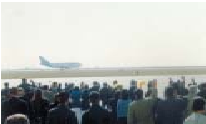
Папа покидает Казахстан

Да благословит тебя, Казахстан, Господь Бог и сохранит во веки!