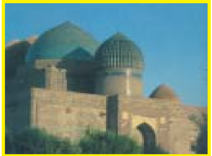
Мавзолей Ходжи Ахмеда Ясави

И вот сегодня по личному приглашению Президента Нурсултана Назарбаева, Вы, Ваше Святейшество, как глава Ватикана с более чем двухтысячелетней историей, являетесь го-