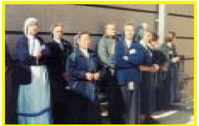
После Святой Мессы

И Ты, Пресвятая Дева Мария, Царица мира, поддержи этих Твоих чад. Тебе ониверяют себя сегодня с обновленным доверием. Божия Матерь Неустанной Помощи, Ты, Которая из этого собора обнимаешь всю церковную Общину, помоги верующим самоотверженно свидетельствовать свою веру, дабы Евангелие Сына Твоего прозвучало в каждом уголке этой возлюбленной и беспредельной земли. Аминь!