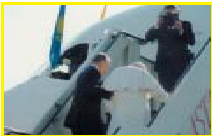
Отбытие Папы в сопровождении президента

Святой Отец! Мы собрались в Казахстане. Мы обещали, что каждый из нас сделает все для того, чтобы жители Казахстана приблизились ко Христу и Церкви.