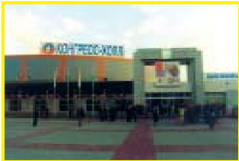
Место встречи с представителями мира, культуры, искусства

Папы и всей Католической Церкви ко Всевышнему и Всемогущему Богу, дабы Казахстан, верный своему естественному евроазиатскому призванию, продолжал оставаться землей встречи и радушного приема, на которой мужчины и женщины двух великих Континентов могли бы жить долгие дни в благополучии и мире.